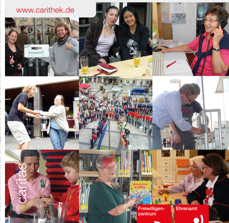
Foto: Renate Steinhorst, Stefan Gürtler, Ruth Knappheide, Veronika Birley, Rochus Münzel, Cornelia Günth, Larissa Eckerich / Stand 05/2016 / 1. Auflage

Sie möchten sich engagieren? Mit der CariThek finden Sie ein passgenaues Engagement.